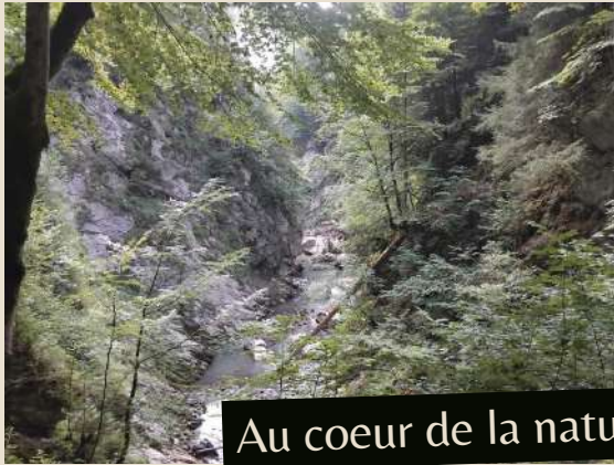
Au coeur de la nature

« Le Jotty et la Forclaz étaient deux villages séparés par des gorges. Les villageois de ces deux villages ont eu l'idée de faire un pont pour les relier. Mais à chaque fois, le pont n'a pas tenu. Ils ont décidé de confier leur sort au Diable qui accepta en échange de la première âme qui traverserait le pont. Pour feinter le diable, les villageois ont choisi d'envoyer une chèvre sur ce pont, ce qui énerva le Diable qui cassa le pont et qui augmenta la taille des gorges. »