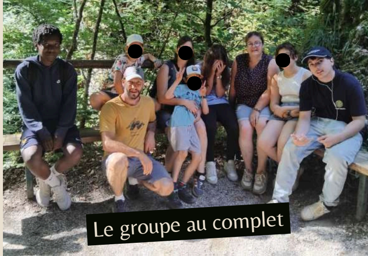
Le groupe au complet